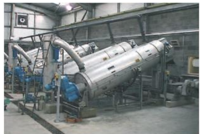
Šeši lygiagrečiai sumontuoti ROTAMAT® sraigtiniai presai RoS 3.