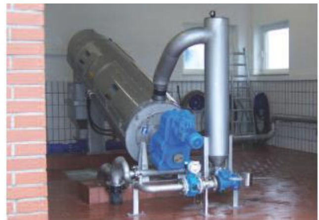
ROTAMAT® sraigtinis presas RoS 3, apdorojantis 8 m³/h.