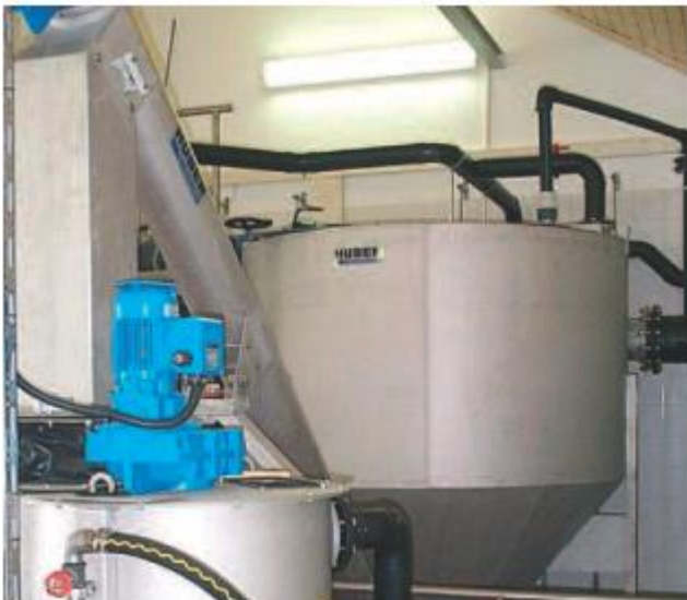
HUBER apvali smėliagaudė HRSF su integruotu šalinimo sraigto ir toliau įrengtas HUBER smėlio plovimo įrenginys RoSF4/t.

HUBER apvalios smėliagaudės HRSF konstrukcija buvo kuriama remiantis daugybe projektų, ji yra išbandyta ir patikrinta faktinėmis sąlygomis bendradarbiaujant su Vokietijos bandymų institutu LGA.