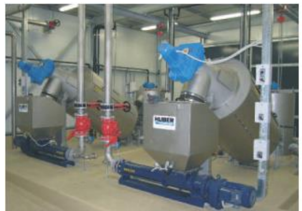
Du RoS 2 įrenginiai, apdorojantys 80 m 3 /h.