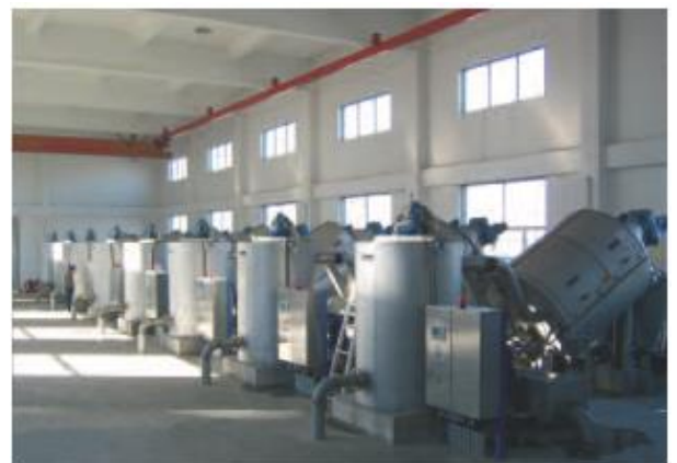
Aštuoni sraigčiai dumblo tankinimo įrenginiai, apdorojantys 600 m 3 /h.